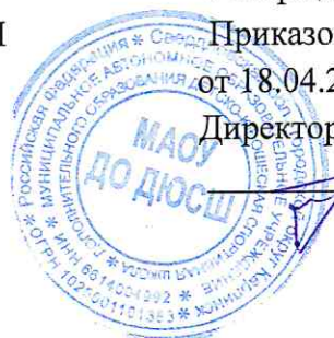
График тематических консультаций по вопросам аттестации педагогических работников МАОУ ДО ДЮСШ в 2023 году